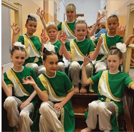
Закулисье. «Импульс» выбрал индийские мотивы.

«Кристалл», «Вдохновение», Центр дополнительного образования, объединивший под крылом дворовые клубы, – перечислять участников можно долго. Конечно, в строю «Данс-парада» прошли творческие коллек-