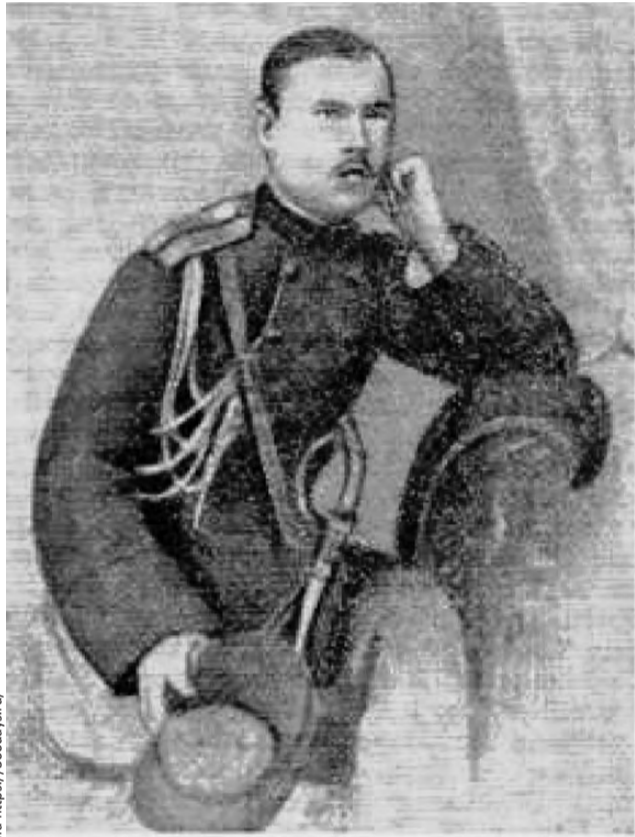
Ф. Ф. Павленков в офицерском мундире (редкая фотография)

На полке домашней библиотеки еще советского образца непременно должна была быть серия «Жизнь замечательных людей», «ЖЗЛ», как привычнее ее называть. Она здравствует по сей день. У самого цикла очень интересная биография: его создатель – крупнейший издатель-просветитель Флорентий Павленков. Ему суждено было пережить забвение после революции и возрождение – в 90-е годы при содействии ЮНЕСКО. В следующем году 20 октября исполнится 185 лет со дня рождения этого истинного подвижника.