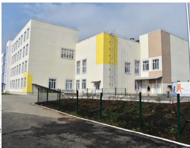
Открытие нового здания школы №22 стало по-настоящему значимым событием

Первый центр «Точка роста» в Первоуральске открыли четыре года назад в школе поселка Новоуткинск. На создание современного пространства для изучения технологии, информатики и ОБЖ с помощью новейших цифровых технологий направили почти пять миллионов рублей. Появление в городском округе центров дополнительного и доступного образования для жителей отдаленных территорий органично вписалось в проект «Уральская инженерная школа». Его реализацию в Первоуральске начали в 2018 году.