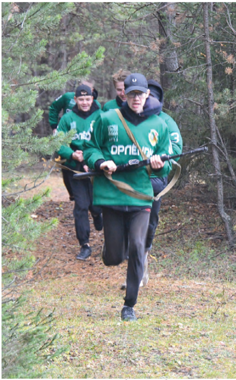
Вся «зарница» – это забег от рубежа до рубежа