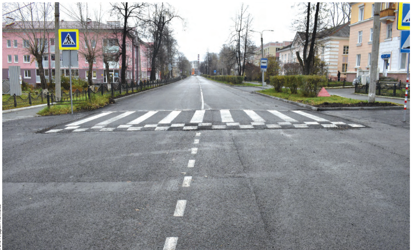
Улица Ильича: здесь заменили асфальт, бордюры, оснастили дорогу «лежачими полицейскими»