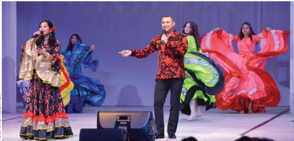
Выступают гости Первоуральска

В Первоуральске вновь прошел фестиваль цыганской культуры «Рома Урала», объединяющий тех, кому по сердцу культура вольного народа – неважно, какого ты рода-племени и где живешь. А таких немало: гала-концерт прошел с аншлагом!