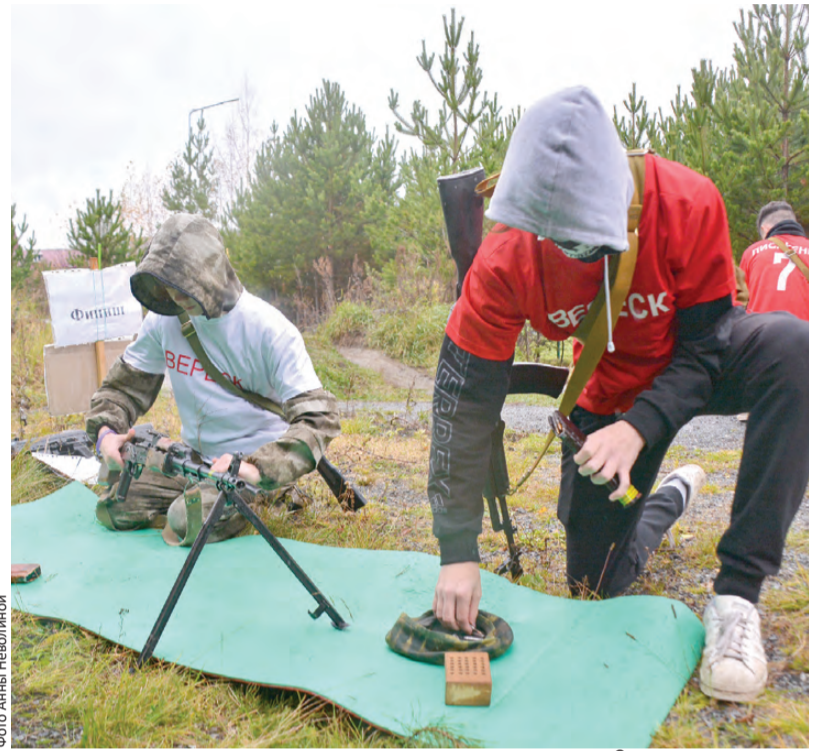
Счет идет на секунды