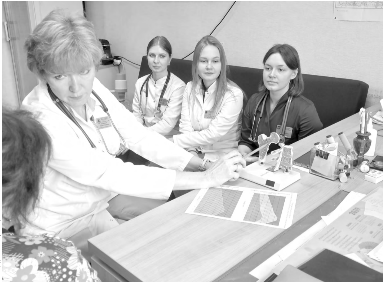
Без лечения остеопороза риск следующих переломов достигает 86%