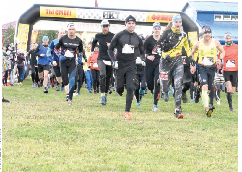
А это уже взрослые