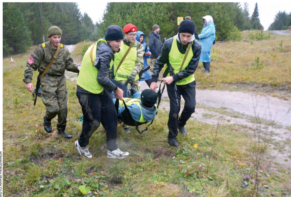
Спасение раненого – командная работа

Штурмовые отряды проходили рубежи согласно жеребьевке, по одному. Первыми, к слову, суждено было стать отряду из клуба «Вереск» – поселка Вересовка. Старшая возрастная группа преодолела полосу препятствий, включавшую сборку/разборку АК-74 и снаряжение ма-