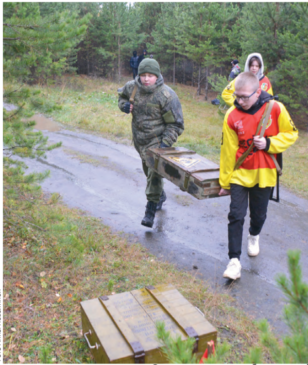
Отряду срочно нужны боеприпасы!