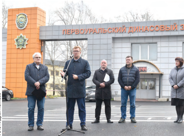
Митинг у проходной ОАО «ДИНУР», посвященный официальному открытию дорог

В микрорайоне Динас капитально отремонтировали дорожное полотно на четырех ключевых улицах. Самый масштабный за последние годы ремонт стал возможен благодаря сотрудничеству администрации города и ОАО «ДИНУР». Работы завершились 3 октября, а официальное открытие данных участков состоялось в минувший понедельник.