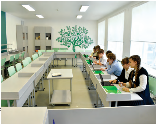
В 2023 году в Первоуральске открылась уже пятая «Точка роста»

Мини-кванториумы в детских садах и естественно-научные центры в школах. Это лишь часть уникальных проектов, созданных в городской системе образования. Мы продолжаем специальный проект «Первоуральск для тебя». Сегодня расскажем, как за последние пять лет менялся не только внешний облик образовательных учреждений, но и как создавались условия для качественного образования детей и подростков.