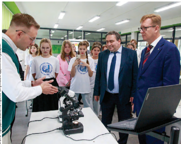
Естественно-научные центры есть в лицее №21, школах №№4 и 9