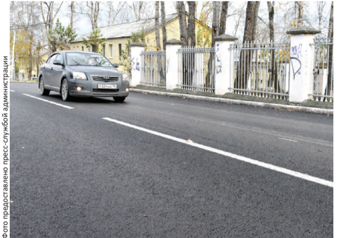
Улица Пушкина: одна из четырех дорог, где уложен асфальт местного производства