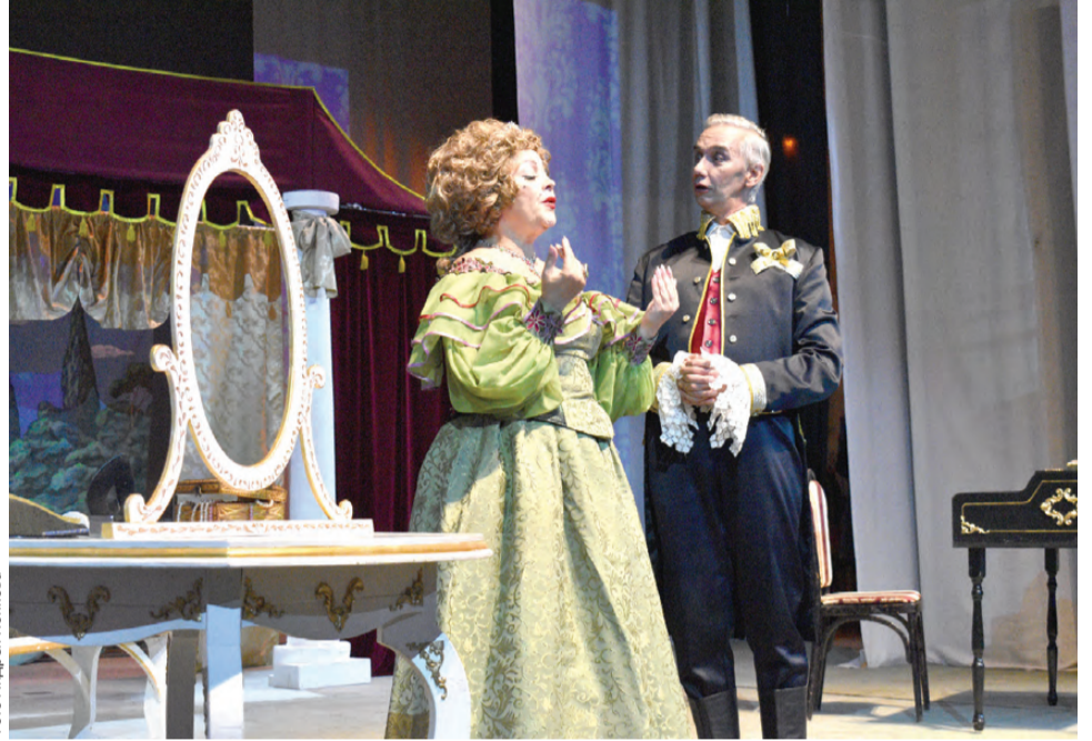
Водевиль в подарок от театра «Вариант»

Напомним, в прошлом году по инициативе администрации и медицинских организаций Первоуральска был утвержден план мероприятий по созданию благоприятных условий труда для медицинских работников. Его цель – привлечь и удержать медицинские кадры в городском здравоохранении. В рамках исполнения этого плана администрацией и было приобретено служебное жилье. При этом, к слову, учитывалась его близость к месту работы получателей, чтобы обеспечить им наибольший комфорт.