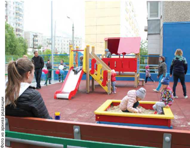
Маленьким дворам внимания не меньше, чем большим