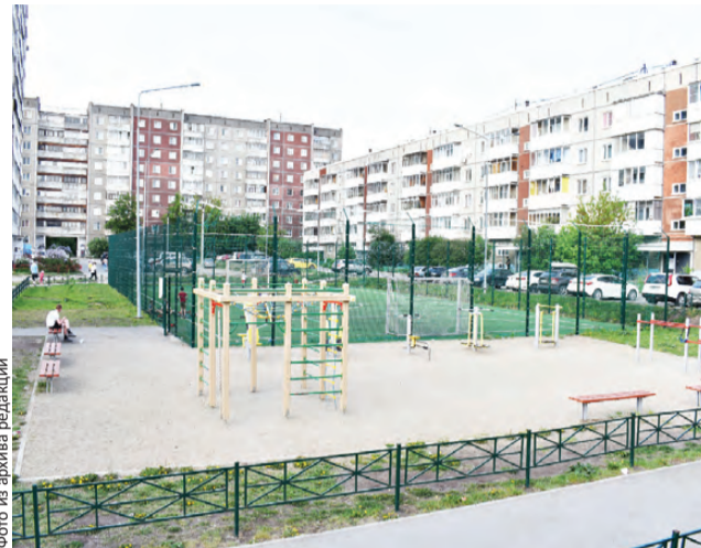
Во дворе на ул.Трубников есть и корт, и воркауты