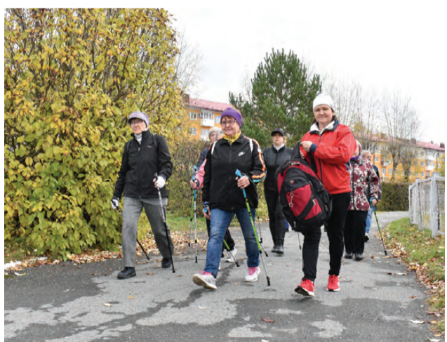
Шагаем весело и дружно

После круга по центральному стадиону те, кому это было по силам, продолжили ходьбу в Парке новой культуры. Остальные включились в спортивные баталлии. Кто-то остался на свежем воздухе, чтобы сразиться в городки. Кто-то – перемесился под крышу Дома спорта, там играли в настольный теннис, дартс, волейбол и шахматы. А в фитнес-зале организо-