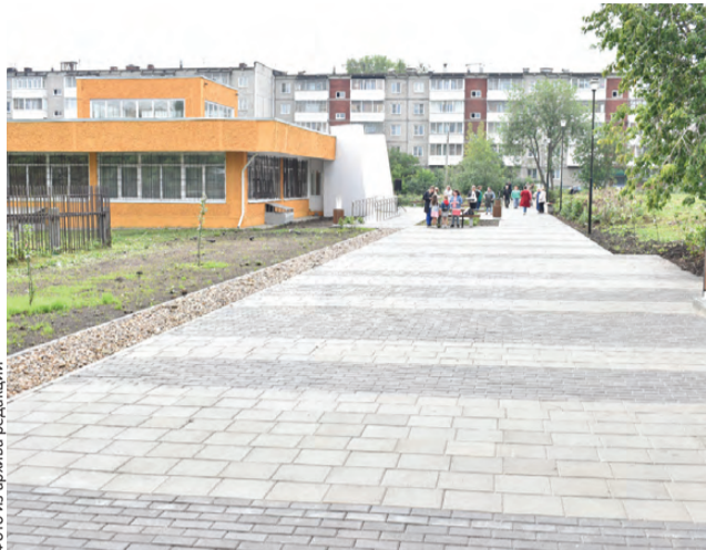
На новой аллее ежедневно гуляют десятки первоуральцев

Мы продолжаем специальный проект «Первоуральск для тебя». Сегодня расскажем, как меняется Первоуральск не только на гостевых маршрутах, но и во дворах.