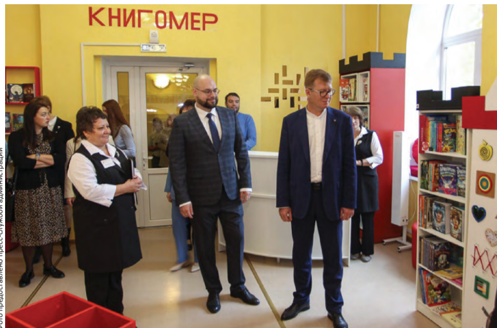
Экскурсия по обновленной библиотеке

Библиотека №4 на Ватутина, 25, стала модельной. Открытие современного пространства состоялось в минувшую пятницу. Теперь в библиотеке можно читать, уютно устроившись на подоконнике, самому снимать мультфильмы или (это для ребят помладше) заниматься в интерактивной песочнице.