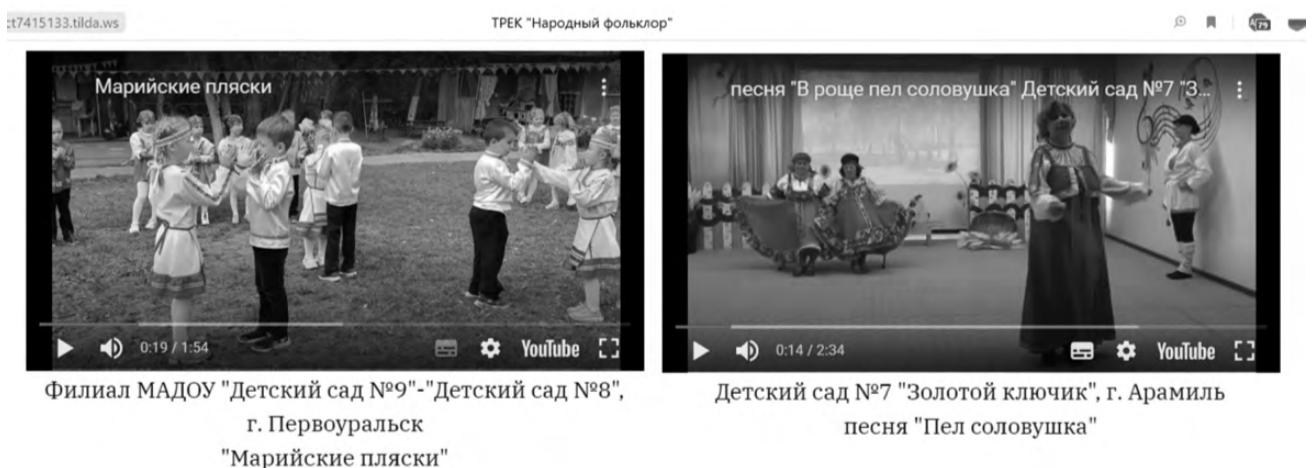
Филиал МАДОУ "Детский сад №9" - "Детский сад №8", г. Первоуральск "Марийские пляски"

Фестиваль «Уральскими тропами: путешествие по календарю» продолжает расширять свою географию. Так, в этом году к нему присоединились челябинцы. Одним словом, такой формат приобщения к краеведению доказывает свою успешность.