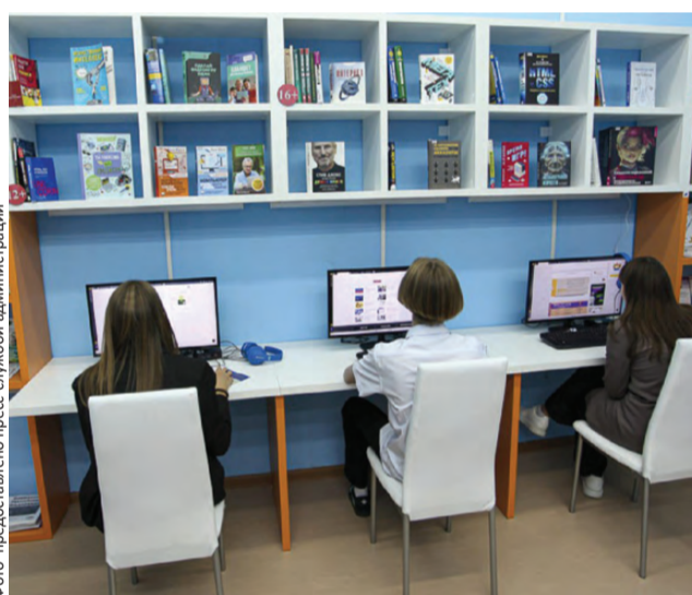
Библиотека – это теперь не только полки с книгами

То, что сразу бросается в глаза – «мягкие» подокон-