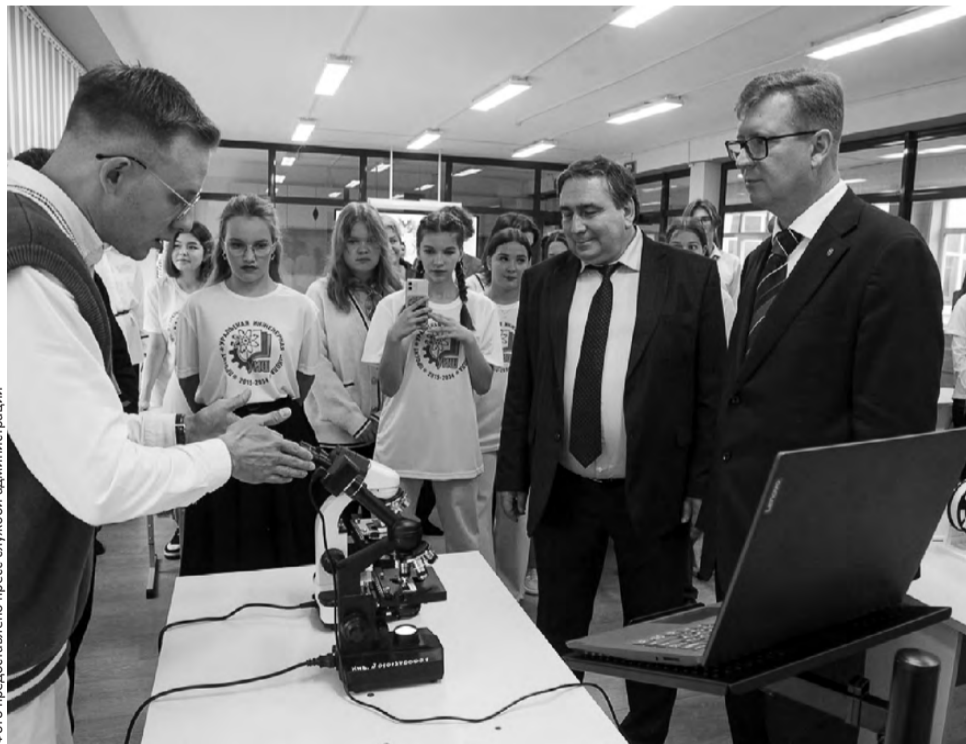
«Урок» для почетных гостей

Динамичное развитие современной системы образования, появление инновационных подходов и приемов относительно учебного процесса, преподавания и работы с обучающимися в контексте формирования ключевых компетенций согласно новым образовательным стандар-