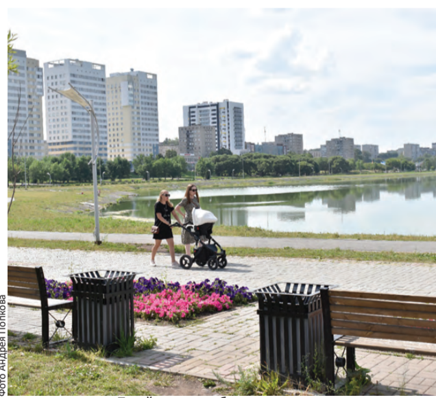
Такой и должна быть современная городская среда