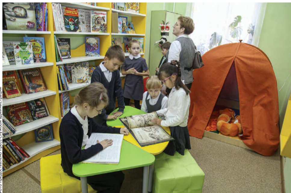
Юные читатели уже освоились в новом пространстве

Но обо всем по порядку. Одними из первых новое модельное пространство оценили почетные гости: Роман Дорохин, заместитель министра культуры Свердловской области; Игорь Кабец, глава Первоуральска; и Галина Селькова, председатель Первоуральской городской думы.