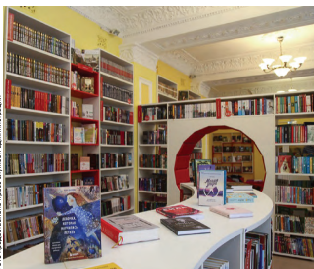
И все же на первом месте – литература