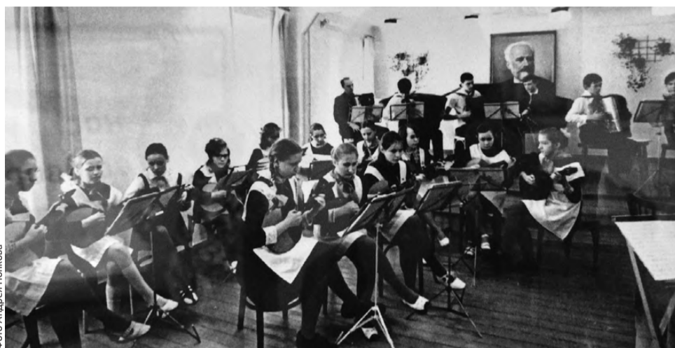
1975 год: идет смотр-конкурс ансамблей

Фотовыставка «Там, где живет искусство», а это 35 черно-белых фотографий, как раз и рассказывает об учениках и преподавателях. Весной