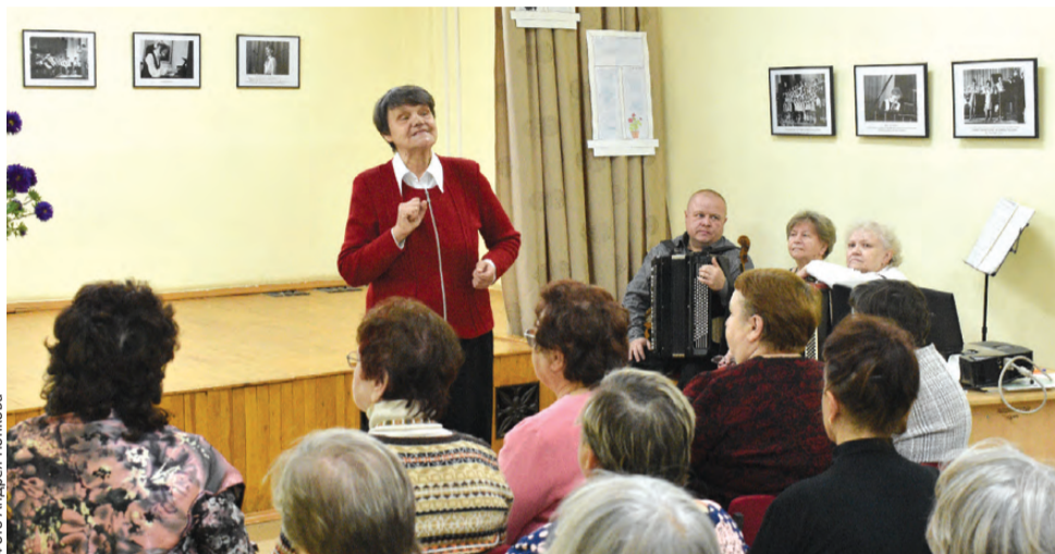
На открытии выставки был полный зал

Первоуральская детская школа искусств этой осенью отмечает 70-летие. Одно из юбилейных мероприятий – фотовыставка «Там, где живет искусство», посвященная истории школы. Она разместилась в Центральной библиотеке. Открытие было необычным: преподаватели, запечатленные на старых фото, поделились воспоминаниями и стали участниками концерта.