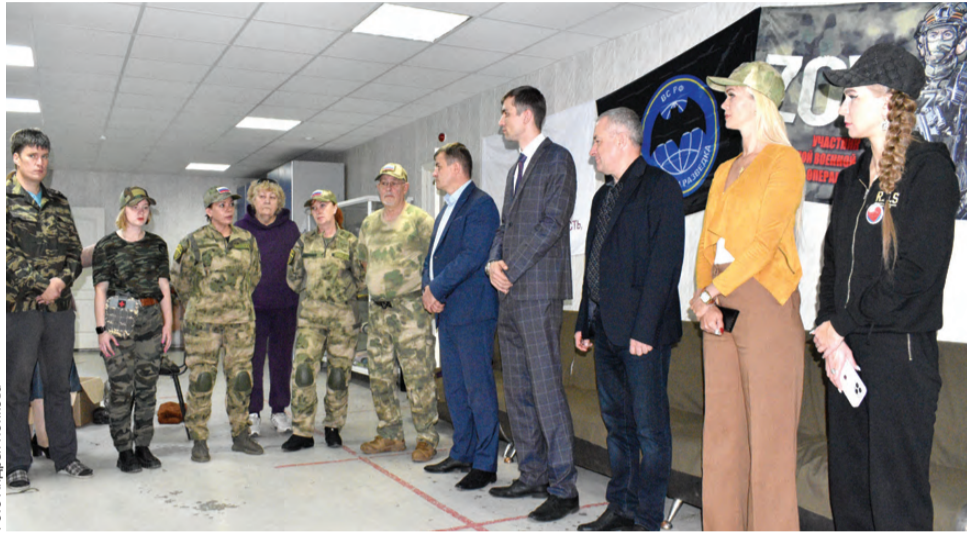
«Женская гвардия Урала»: первый общий сбор

Отряд из 24 девушек приступает к боевой подготовке, которую они пройдут на курсах первоуральского отделения «Женской гвардии Урала». Наставник по рукопашке, офицер с боевым опытом, пообещал учить нежно. Сами же ученицы настроены по-боевому.