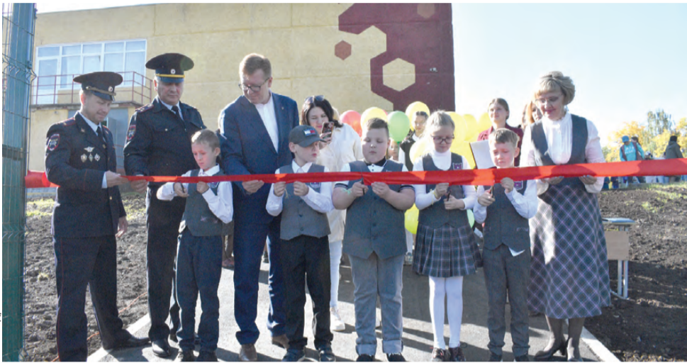
Торжественный момент: ленту перерезают сами ребята

В школе №4 открыт первый в Первоуральске автогородок для обучения детей и подростков правилам дорожного движения. В городке все по-настоящему: работающие светофоры, перекрестки с «зебрами», автомобильное движение, проезжая часть с настоящими дорожными знаками.