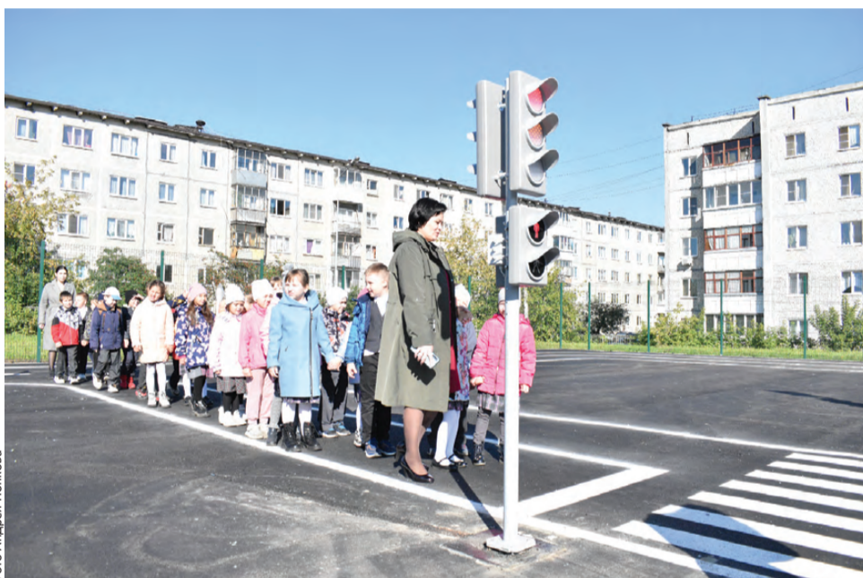
Занятия по изучению ПДД теперь стали более наглядными