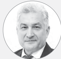
Юрий БИКТУГАНОВ , министр образования и молодёжной политики Свердловской области:

Напомним, в Свердловской области в рамках инициативы губернатора Евгением Куйвашевым программы «Уральская инженерная школа» и регионального проекта «Молодые профессионалы» совместно с предприятиями создано около 200 мастерских на базе образовательных организаций. Сеть производственных площадок в уральских колледжах и техникумах позволяет готовить