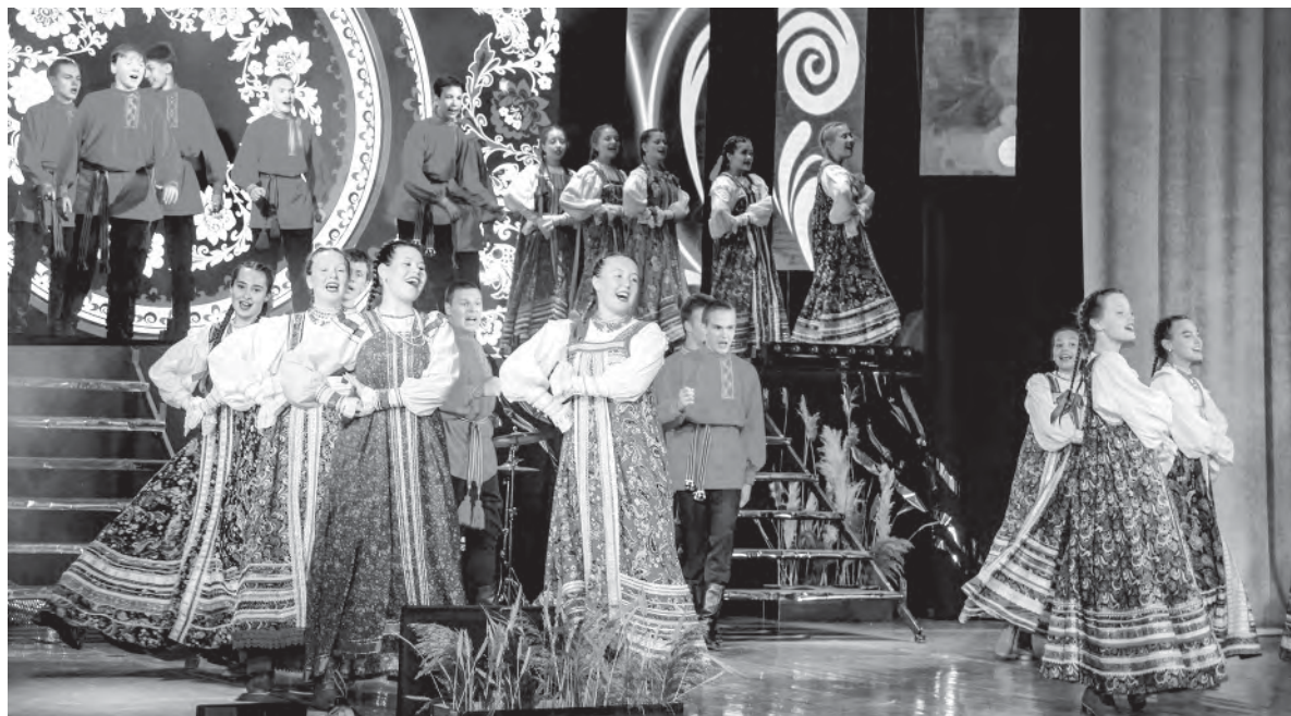
В русских народных костюмах традиционно выступают участники фольклорного ансамбля «Перезвоны» Детской музыкальной школы №1. Не стало исключением празднование Дня города – 2023

– Было бы неплохо, если бы у нас, в Полевском, была