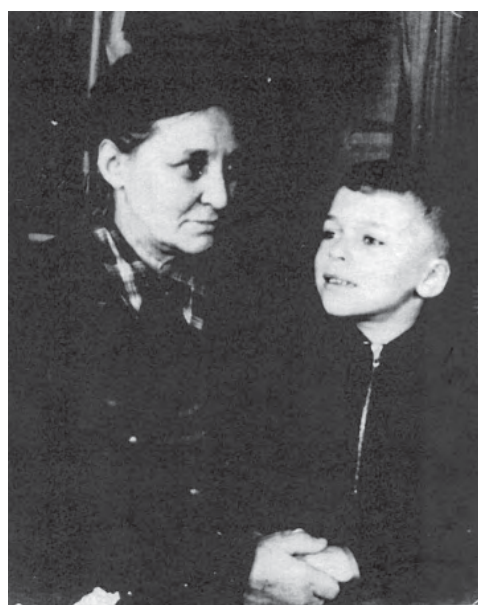
Музейные фотографии, отражающие школьную жизнь, как живые голоса истории, проникнутые подкупающей искренностью

пользовалась уважением у односельчан, за подвижнический труд была награждена орденом Ленина.