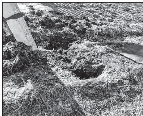
Наружу стоки выходят из дыры в земле