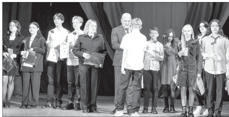
17 юных полевчан – участники всероссийского проекта «Мы – граждане России» в торжественной обстановке получили паспорт гражданина РФ

Военный опыт у майора полиции в отставке имелся: в годы службы он дважды был в командировке