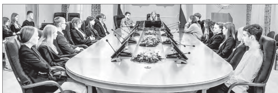
Полевские одиннадцатиклассники побывали в презентационном зале и зале заседаний Избирательной комиссии Свердловской области

Полевские одиннадцатиклассники побывали в презентационном зале и зале заседаний комиссии. В презентационном зале они рассмотрели оборудование, использовавшееся избирательными