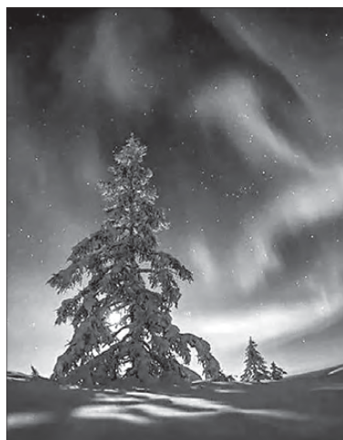
10 лучших мест для фотоохоты на полярное сияние