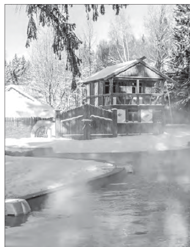
Лучшие спа-отели и санатории по всей России