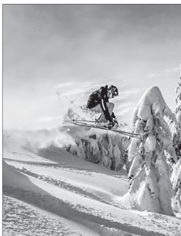
Лучшие горнолыжные курорты от Сочи до Камчатки