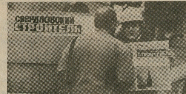
• Спорт и здоровье