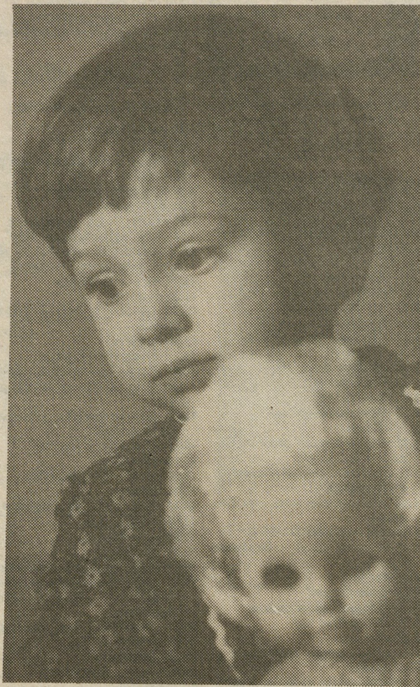
Сегодняшние дочки-матери, какими они станут, когда вырастут?..