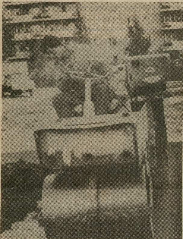
Машинист катка Игорь Московкин работает на благоустройстве одного из домов, построенных ДСК.

Выбирайте цены, способы доставки, выбирайте «Областную газету»!