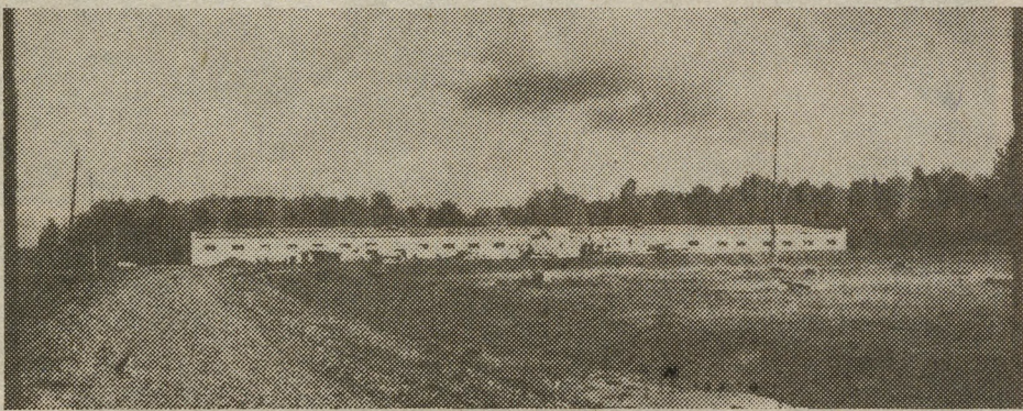
● В подсобном хозяйстве ДСК

ВЫХОДИТ С 13 ЯНВАРЯ 1974 ГОДА № 40 (1030) ПЯТНИЦА, 1 октября 1993 ГОДА Цена по подписке — 1 руб., в розницу — свободная.