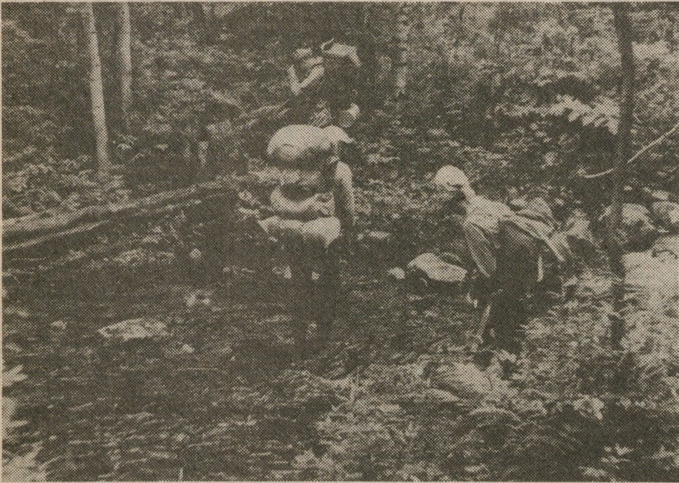
НА СНИМКЕ: «Лето ярким солнышком согрето, лето — это хорошо!»

Лето — отпускная пора не только для взрослых. Многие ребята вместе с родителями выезжают за город. В детских комбинатах в эту пору становится относительно тихо.