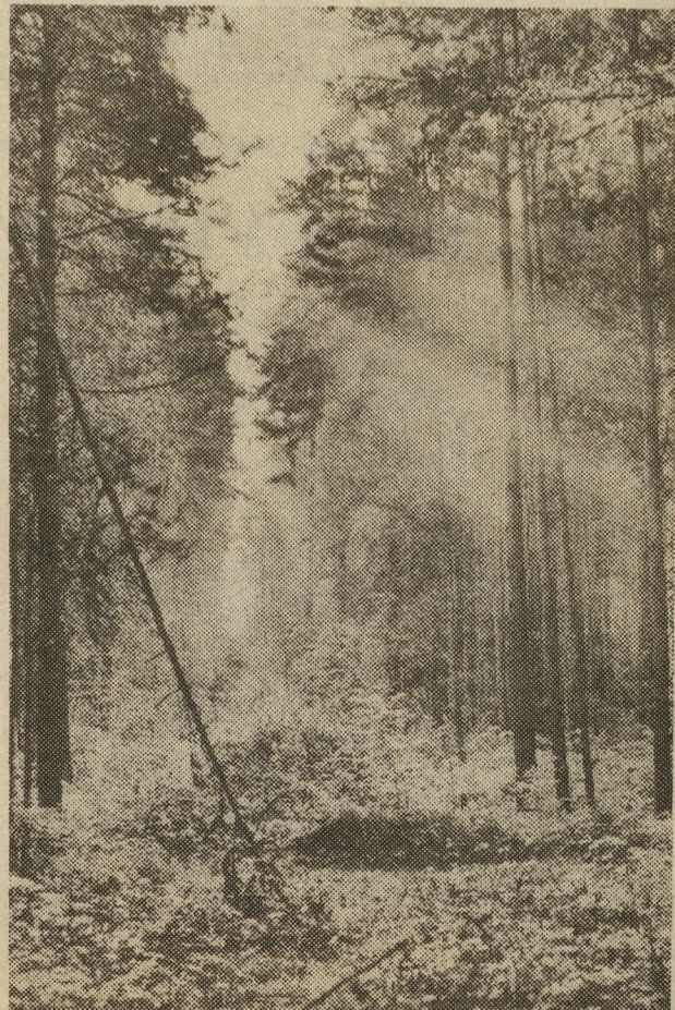
Утро в сосновом бору.