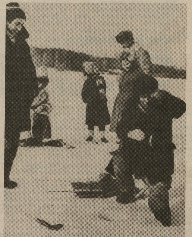
По последнему льду.

начальник отделения ГАИ Кировского РОВД.