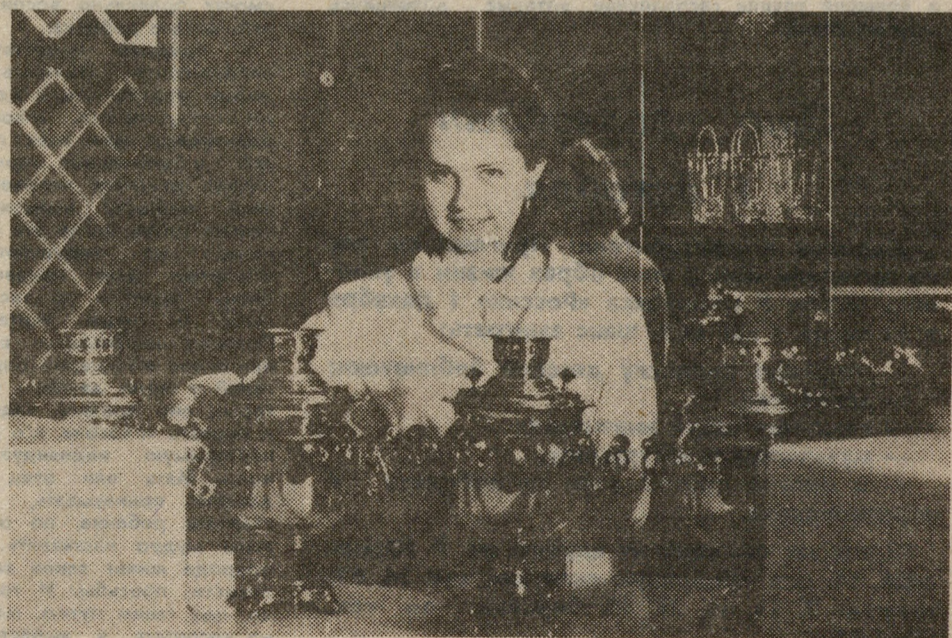
Около года в аптеке № 3, которая располагается на ул. К. Либкнехта за филармонией, действует фитобар. Здесь всегда можно спокойно и уютно посидеть за чашкой чая из сборов лекарственных трав.

лей. А жизнь [которая дорожает не по дням...] диктует теперь свои жесткие условия: покупившись на 400 тысяч на аппарат УЗИ, комбинат вынужден выплачивать ежегодно по 100 тысяч за обслуживание своих пациентов. А пациентов у нашего предприятия много. Участок, который обслуживает наш комбинат, постоянно загружен работой: обращаются, в основном, пожилые рабочие (штукатуры, монтажники) с серьезными профессиональными заболеваниями. А проводить полноценное, эффективное лечение врачам становится все сложнее. М. ОДИНЦЕВА.