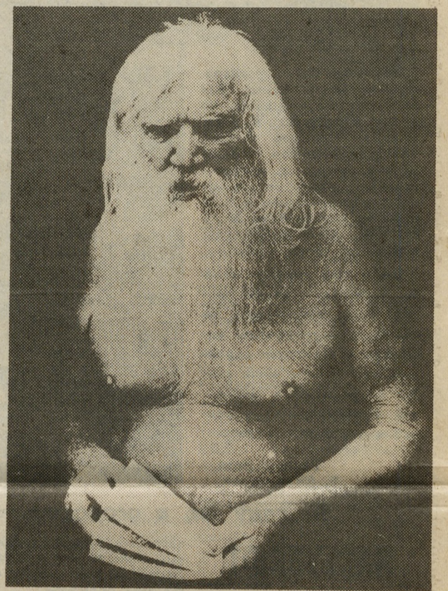
Автор оздоровительной системы Порфирий Корнеевич Иванов, автор «Детки».

дела. Прочитай — хорошо, давай опыт этого дела, но самое главное — делай! не хвались и не возвышайся в этом. Будь скромным.