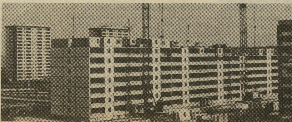
● На монтаже.

За справками обращаться в профком ПСКП «СДСК».