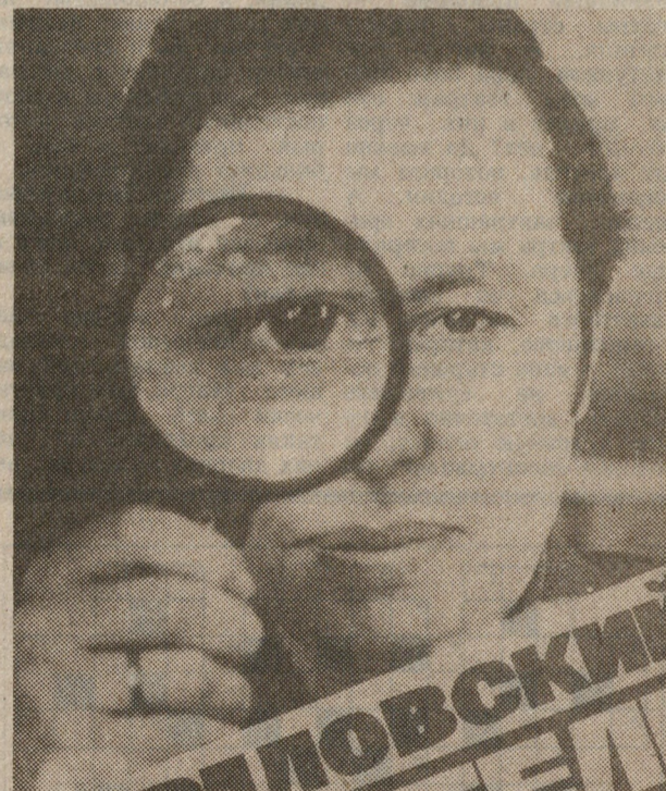
● Интересный ракурс: проблемы под пристальным вниманием газеты; публикации в газете изучает читатель.