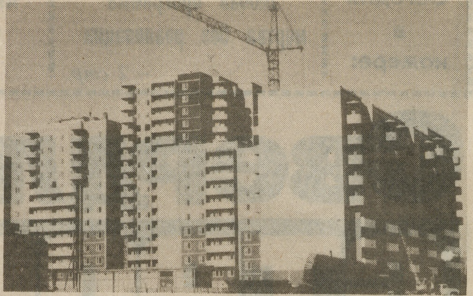
● Растут дома в новом микрорайоне массовой застройки — «Ботаническом».

Производственные же площадки УПТК, их техническое оснащение не позволяют им делать этого, огромное количество материалов при переработке транспортируется вручную. Это относится, в первую очередь, к колерной мастеровой, стеклопозному, жестяному и другим участкам. Как мне стало известно, проект на строительство базы УПТК имеется, также определен источник финансирования, поэтому необходимо в ближайшее время немедленно начать строительство блока цехов