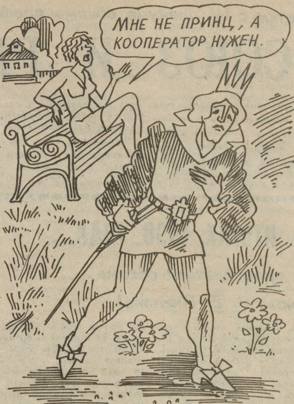
РИСУНОК Е. СНЕЖКО.