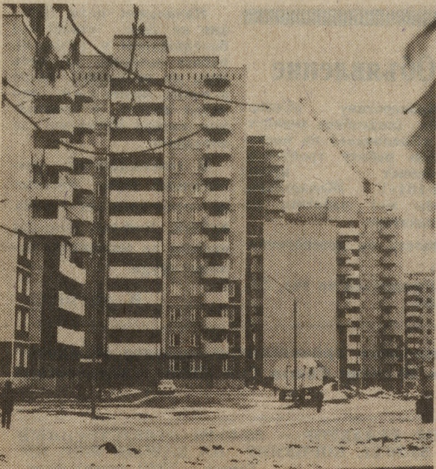
Растет «Ботанический». И вширь, и ввысь...