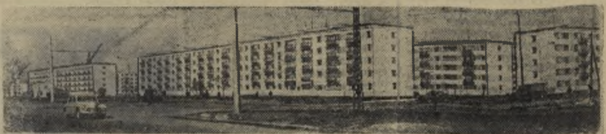
Рига. Новый жилой массив Кенгарагс. Здесь уже более 70 зданий. В нынешнем году рижане получат в этом районе около 100 тысяч квадратных метров жилья.

Фондоотдача (ф.) — важнейший показатель эффективного производства. Определяется отношением валовой продукции к сумме основных фондов. О значении этого показателя говорит следующий пример: если увеличить выпуск валовой продукции на рубль основных фондов на один процент, то народное хозяйство в 1970 году получит продукции на сумму около 3 млрд. рублей. Выпуск продукции с производственных фондов, действовавших на 1 января 1966 года, к концу пятилетки возрастет на 12-15 процентов. Пути к этому лучшая организация производства и труда. (Окончание следует).