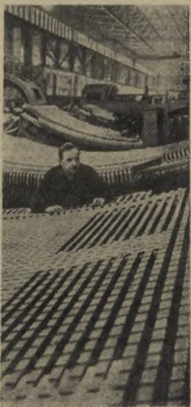
Ленинград. Электромашиностроители объединения «Электросила» изготавливают гидрогенераторы мощностью 175 тысяч киловатт для крупнейшей энергетической стройки в ОАР — высотной Асуанской плотины. Сейчас в гидрокорпусе головного завода изготавливается пятая машина-гигант для Асуана.

На снимке: статор 5-го Асуанского гидрогенератора на обмотке.