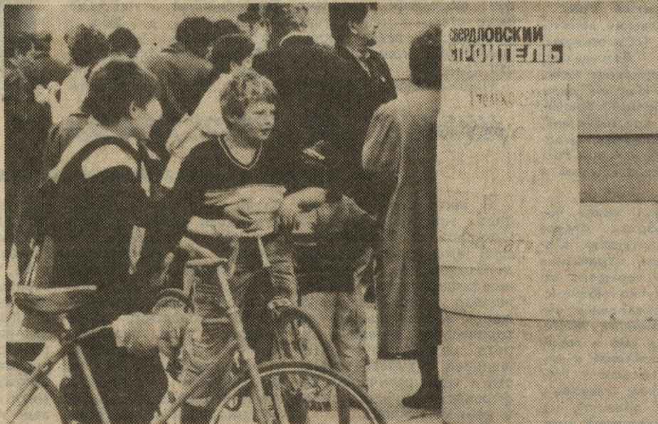
НА СНИМKE В. КАЛИМАСОВА: У СТЕНДА ГАЗЕТЫ «СВЕРДЛОВСКИЙ СТРОИТЕЛЬ» ВО ВРЕМЯ ПРЕСС-ШОУ В ИСТОРИЧЕСКОМ СКВЕРЕ, В ЧЕСТЬ ДНЯ ГОРОДА.