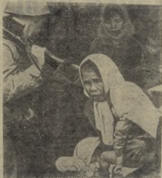
Южный Вьетнам. Плачущие дети и испуганные женщины, выброшенные на улицу из своих хижин американскими морскими пехотинцами, таков «результат» одной из последних операций по прочесыванию.

Скоро начнется суд. Но понесут ли должное наказание главные виновники трагедии, разыгравшейся в Агридженто 19 июля прошлого года? Э. ПАНОВ.