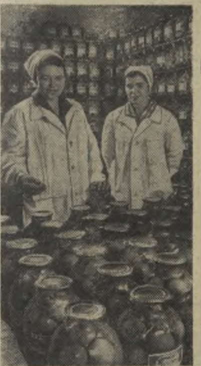
Мценск. Консервный завод. Здесь вырабатывают более 50 видов овощных и фруктовых консервов.

С такого низкого уровня первая страна социализма начала свою борьбу за повышение жизненного уровня народа.