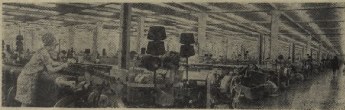
Иваново. Ткацкий цех камвольного комбината.

ного хозяйства, так и в годы индустриализации много сделала для повышения жизненного уровня народа. Вот лишь несколько примеров. По сравнению с 1917 годом выпуск тканей в 1940 году увеличился почти втрое, кожаной обуви — в четыре с лишним раза, трикотажных изделий — почти в 50 раз, сахара — в два с половиной раза, консервов — в 13 раз и т. д. В итоге против 1913 года — лучшего дореволюционного года — продукция легкой промышленности в 1940 году в целом поднялась в пять раз, а пищевой — в четыре с лишним раза.