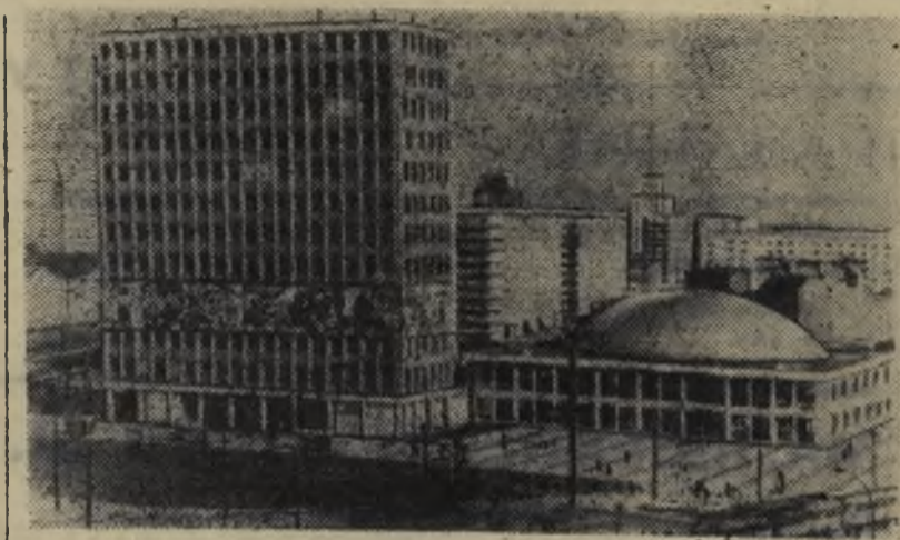
Сегодня, 8 мая, исполнилось 22 года со дня освобождения немецкого народа от фашизма. Крушение гитлеровского рейха вызвало великие исторические перемены на немецкой земле. Возникла и прочно утвердилась Германская Демократическая Республика, которая последовательно осуществляла

принципы Постдамского соглашения, ставшего программой борьбы демократических сил немецкого народа за искоренение милитаризма и фашизма. Государство немецких трудящихся уверенно несет вахту мира в центре Европы и вместе с Советским Союзом и другими странами социалистического содружества активно выступает за укрепление европейской безопасности, против посягательств империалистических сил за свободу и независимость народов, за развитие широкого международного сотрудничества.