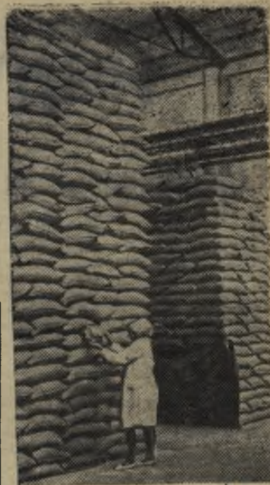
Краснодарский край. На складе Тимашевского сахарного завода.

За пятилетие намечено построить 300 новых крупных пред-