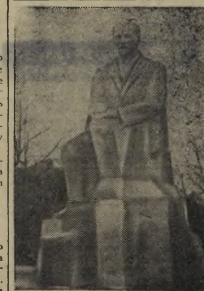
Рига. Памятник известному латвийскому поэту Янису Райнису на площади Коммунаров.

ОТ РЕДАКЦИИ. Хорошо, что рабочие бетоно-растворного узла наконец-то разобрались в причинах неудовлетворительной работы. Теперь дело за руководителями завода. Им необходимо в кратчайшие сроки ознакомиться с предложениями рабочих, внедрить их в производство. Хотелось бы, чтобы ушла замечания в свой адрес и строительная организация города. Одним словом, качество раствора в эти наиболее благоприятные для отделочных работ дни должно быть высоким.