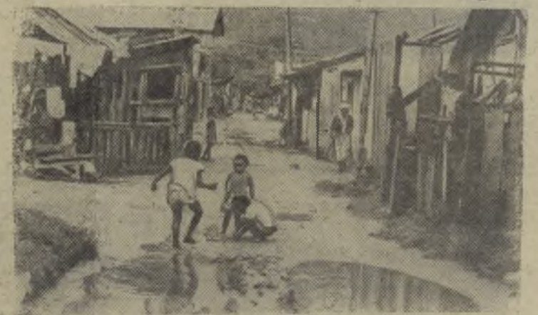
Бразилия. По сообщению английского агентства Камера Пресс, распространявшего этот снимок, одна треть населения Рио-де-Жанейро живет в подобных условиях.

Основную массу жителей фавел (городских трущоб) составляют крестьяне переселившиеся в город в надежде на лучшую жизнь. Едва ли этим надеждам суждено сбыться.