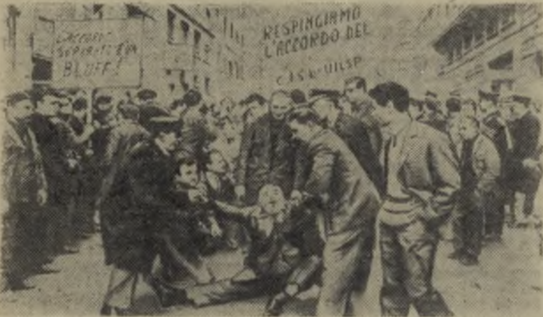
В капиталистических странах ширится борьба трудящихся за свои права. Крупные классовые бои проходят в Италии. На этом снимке запечатлен момент демонстрации работников газовой промышленности Рима. Они выступили с требованием улучшения условий труда. Но, как всегда, в ответ на законные требования, власти бросили полицию, чтобы разогнать демонстрантов.