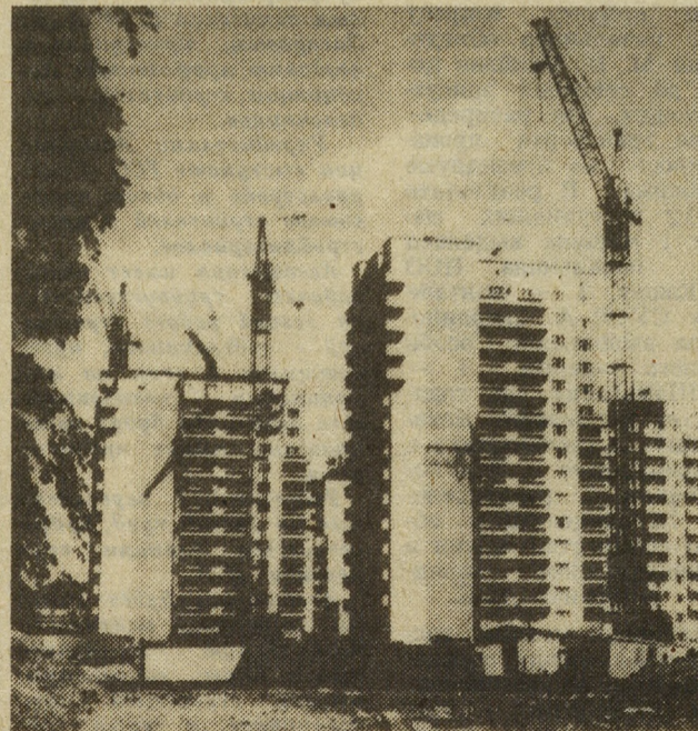
Сегодняшняя панорама «Московской горки» — район массовой застройки, которую ведут строители ДСК. Текст и фото В. Калимасова.

Ю. ШУЛЬГИНА, старший библиотекарь абонемента.