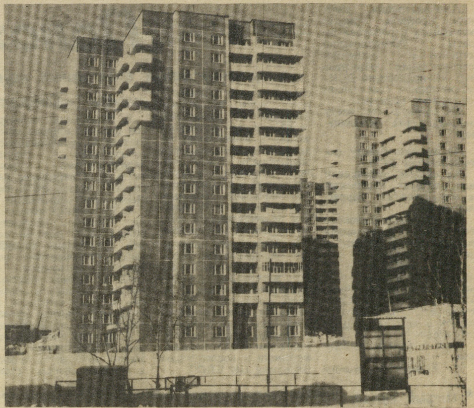
На снимке: уголок микрорайона «Синие Камни».

Л. ДМИТРИЕНКО, инженер ОТиЗ объединения.