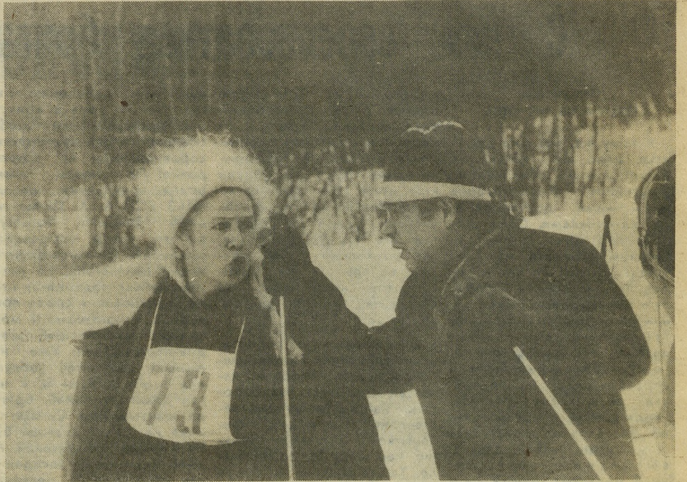
— У. ты какой!