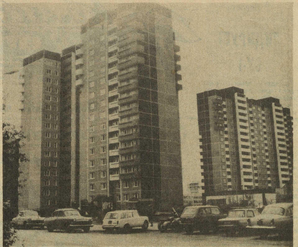
Высотные дома, возведенные нашим коллективом на ул. Сыромятова в микрорайоне «Комсомольский».