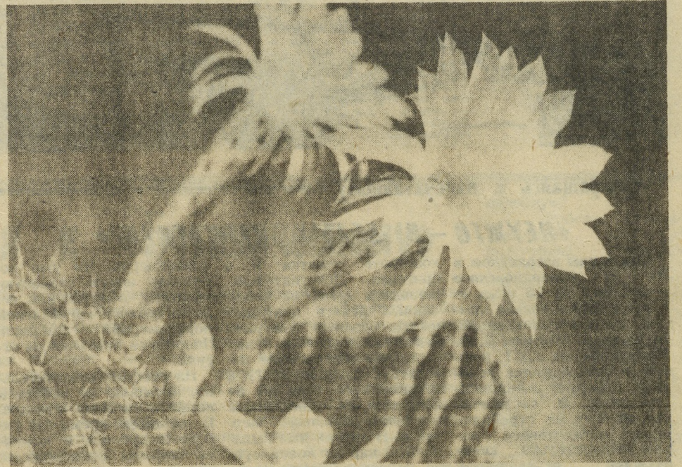
Так цветет кактус.

Обзор подготовила Н. В. СОШКИНА, старший библиотечарь.