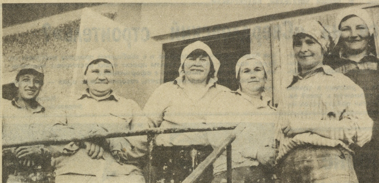
НА СНИМКЕ: члены бригады депутата Верховного Совета СССР Е. П. Маряхиной. Фотография сделана на доме № 26 в микрорайоне «Синие Камни», когда СУ-1 готовило дом к сдаче.