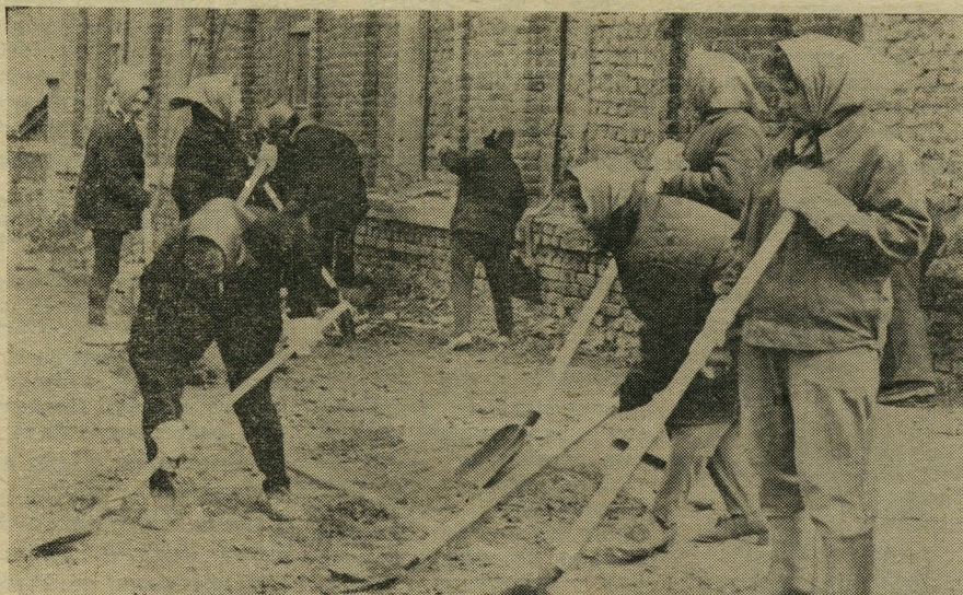
На снимке: работники паросилового цеха на субботнике.