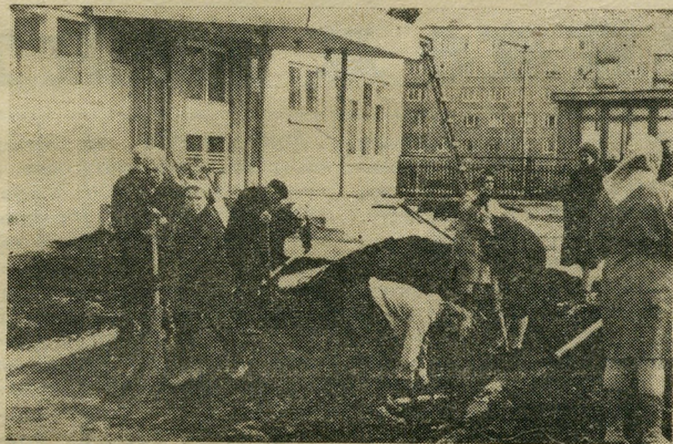
На снимке: на субботнике работники управления ДСК