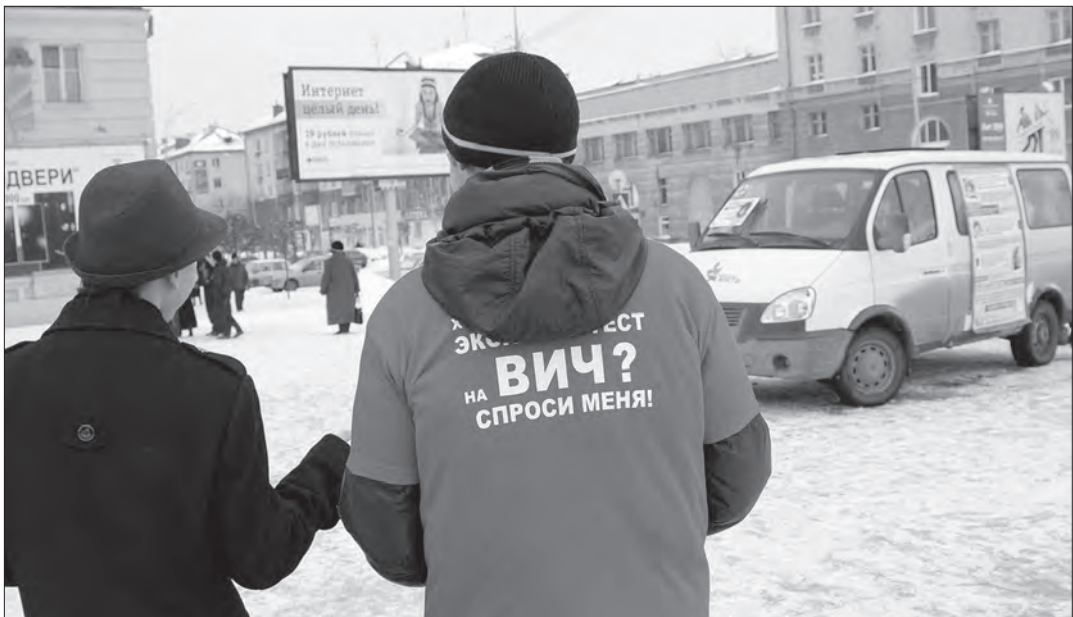
Участники акции.