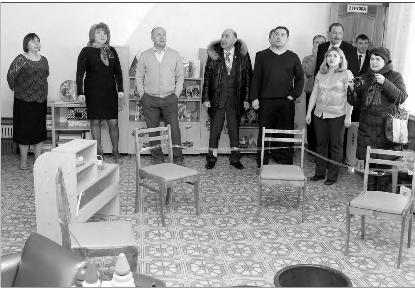
В одной из групп «Росинки».

Под звуки капели приятно гулять на свежем воздухе, но совсем другие эмоции испытываешь, когда талая вода течет прямо с потолка на пол, а ручьи бегут по углам стен. Вот почему долгожданная весна не радует воспитанников детского сада «Росинка», расположенного в районе ВМЗ. В здании протекает крыша, малышам приходится терпеть сезонную сырость и неудобства. Причем дырявая кровля, как выяснилось, далеко не единственная беда помещений постройки военных лет, где еще в 40-х годах прошлого века располагался солдатский госпиталь.