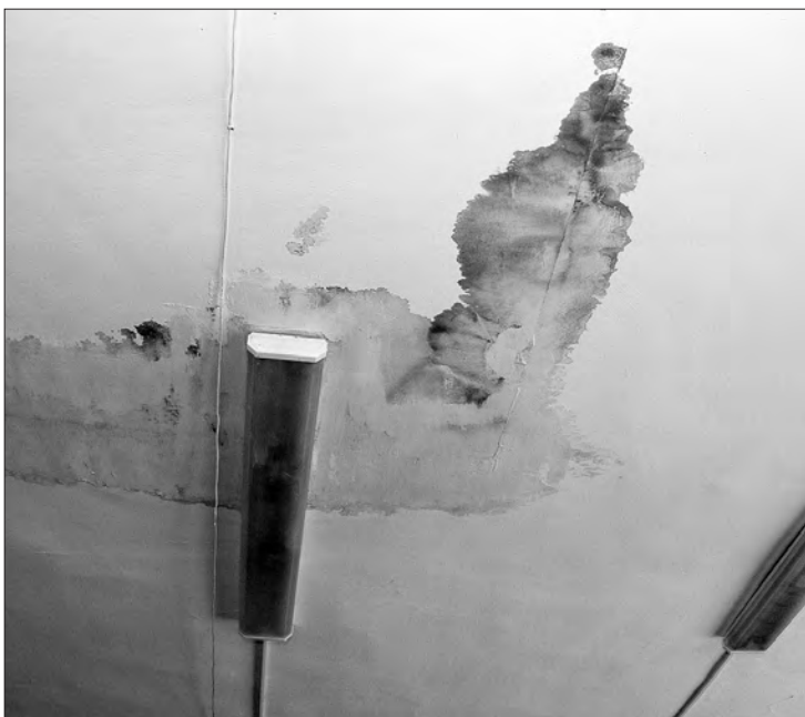
Потолок в подтеках угрожает не только здоровью, но и жизни детей.

Итог недолгого любования «Капитошкой» оказался таков: председатель комис-