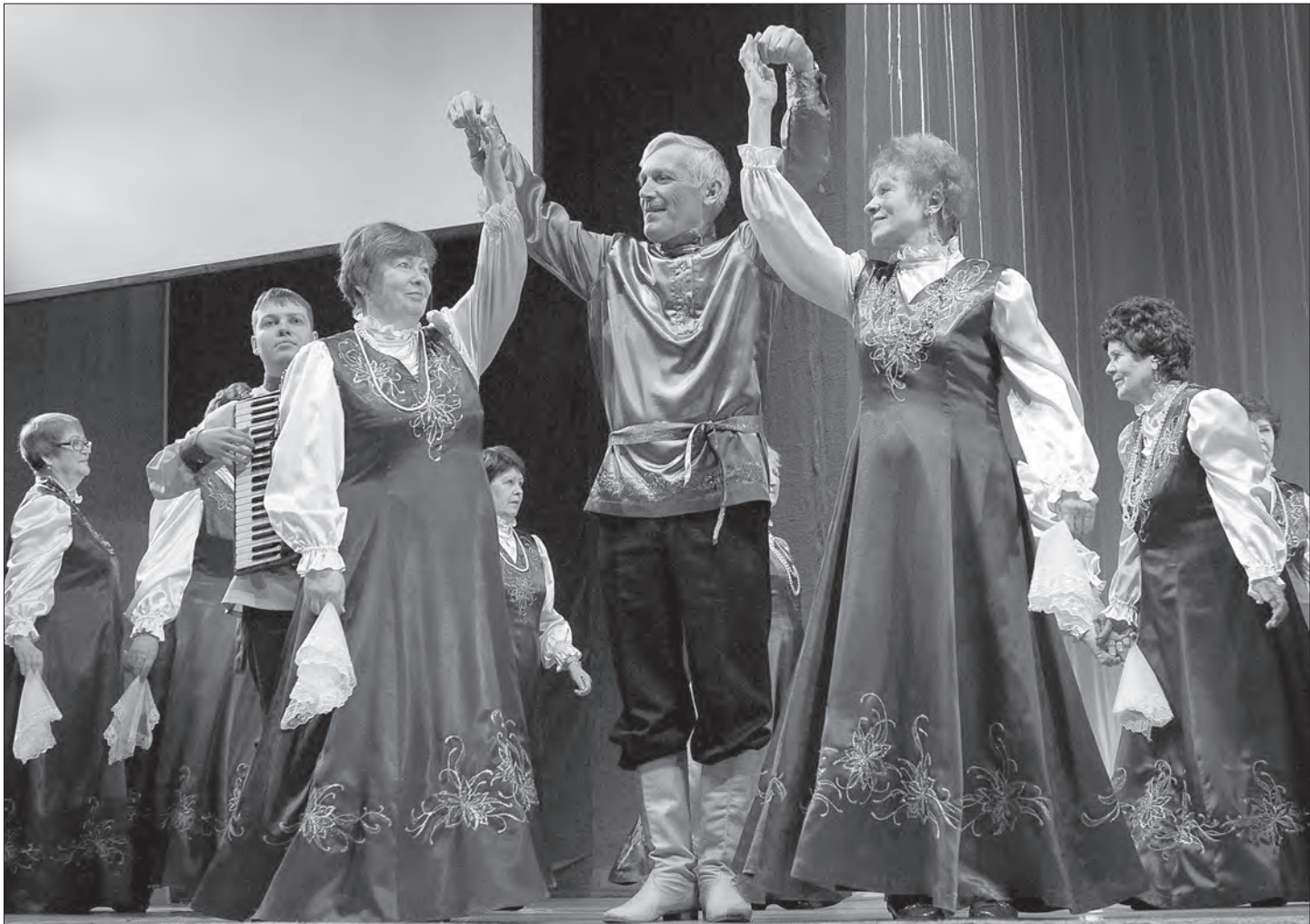
Выступают «Тагильские россыпи».