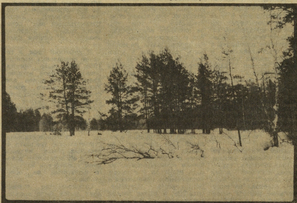
В ОЖИДАНИИ ВЕСНЫ.