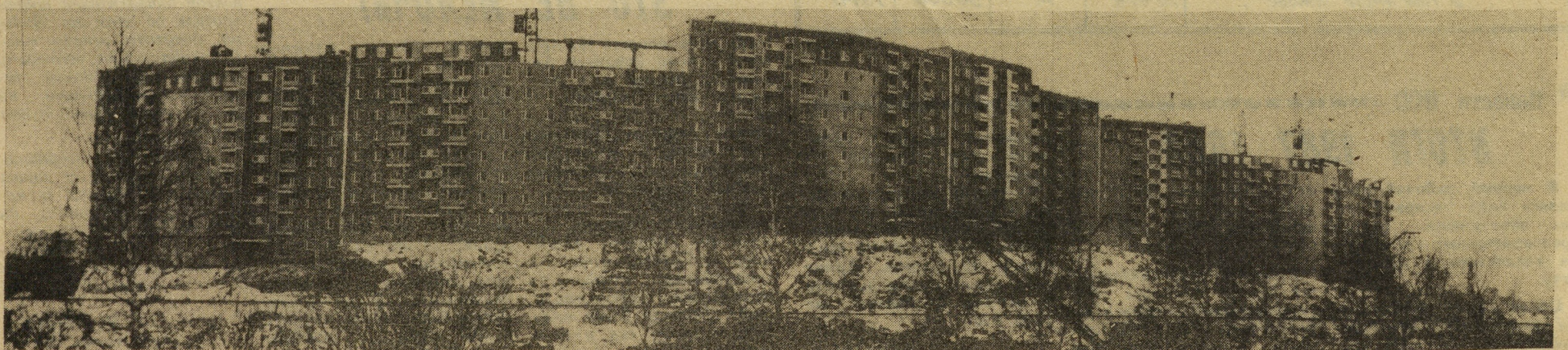
Панорама нового микрорайона массовой застройки «Синие камни», где в конце прошлого года сданы первые дома общей площадью 59 тысяч кв. метров жилья.

(Статья подготовлена по материалам выступления Я. М. Смыка перед секретарями парткомов строительных организаций области).