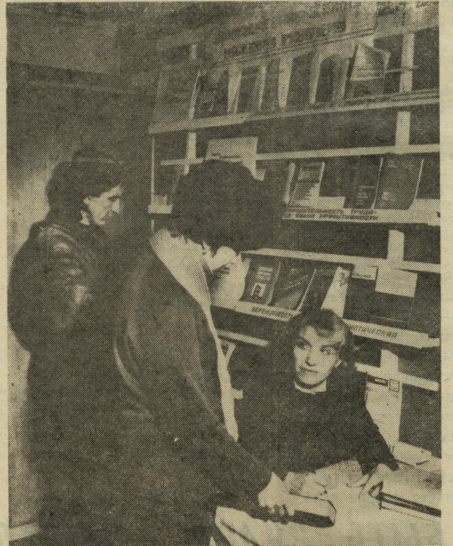
Пропаганда книги большое внимание уделяет профсоюзная библиотека ДСК. На публикуемом снимке вы видите выдачу книг передвижной библиотекой в микрорайоне застройки «Заречном».