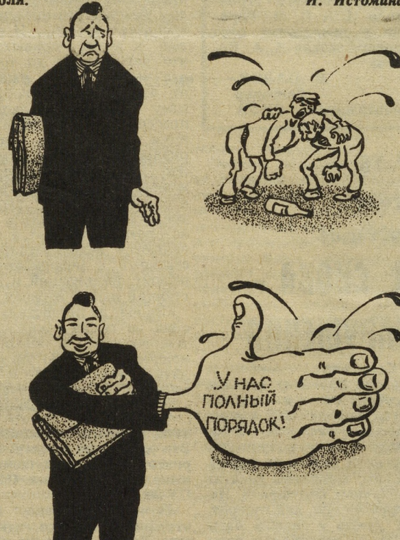
Рисунок художника-оформителя И. Истомина.