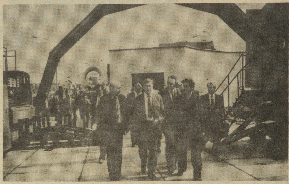
Участники Всесоюзного совещания посетили областную строительную выставку.

ной строительной выставки мы заезжали и осматривали новые микрорайоны «Заречный» и «Академический». Безусловно, за счет «декора» и планировки они красивые, но пустоваты, холодноваты. Взять «Академический»: «посажены» девятнадцатилетние, но дворы голые, и зелени мало, нет «малых форм», я заметила отсутствие соцкультбыта. Это большое упущение строителей и архитекторов Свердловска. В целом же наше совещание очень интересное и полезное. В заключение скажу, что мы научились строить быстро, много, будем строить еще быстрее, еще больше жилья, но нельзя забывать, что строить надо и красиво, и чтобы все: от кухни, квартиры, подъезда, до дома, двора, микрорайона было удобно для человека. Беседовал В. ВЯТКИН.