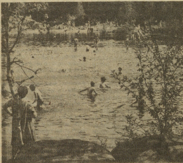
В лесопарке «Каменные палатки».

За справками обращаться по телефону 24-99-61.