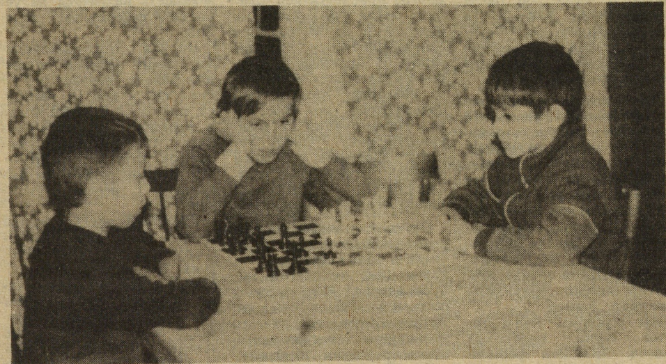
За шахматной доской в детском клубе «Огонек».