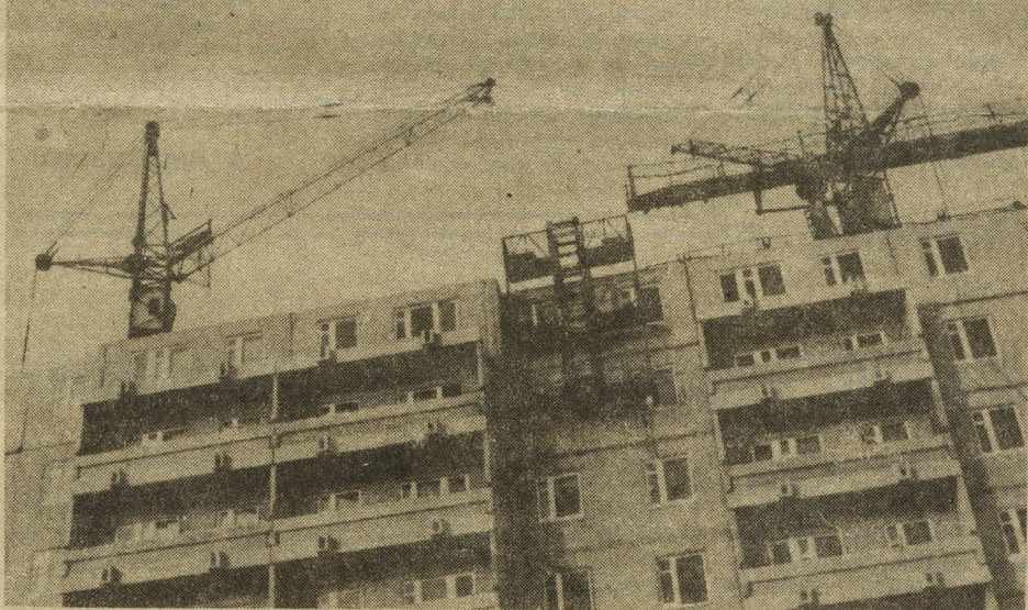
Сегодня бригада монтажников СУ-28 В. Сыщенко монтирует дом № 4Б по улице Бисертской. Слаженной, дружной работой славится этот коллектив.