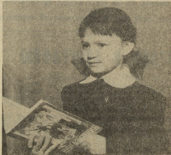
Книга — лучший друг с детских лет.