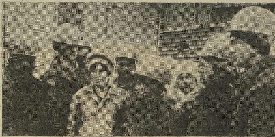
* Заседает совет бригадиров