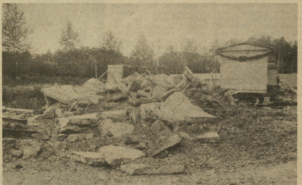
● ФОТО № 2