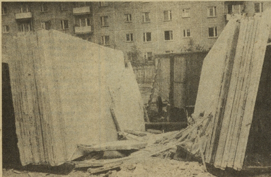
● ФОТО № 1

Фото и текст В. Калимасова, члена центральной группы НК СДК.