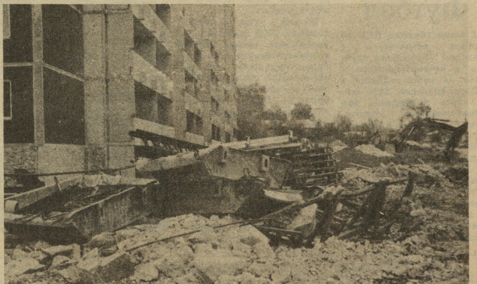
● ФОТО № 3