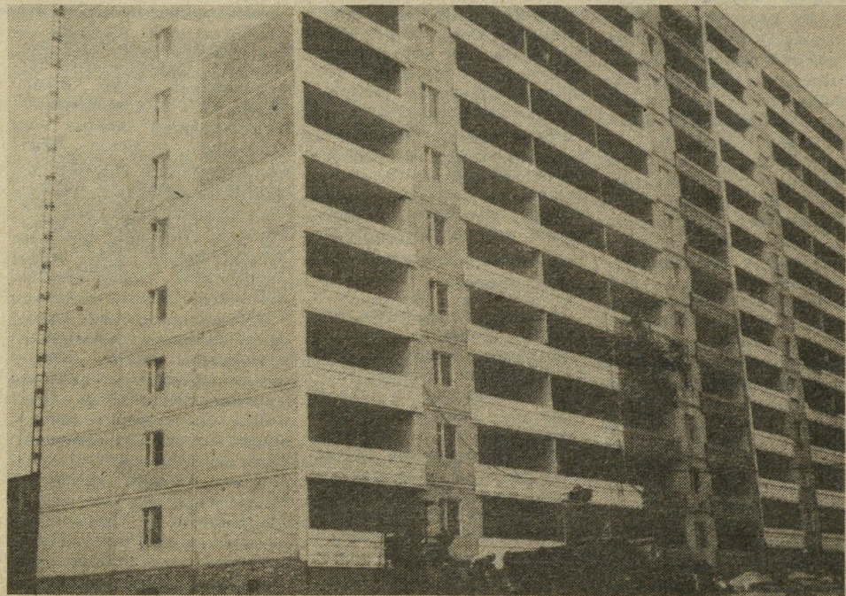
Полным ходом идут отделочные работы на доме № 1 в переулке Коллективный, которые ведут бригады генподрядного строительного управления № 7.

П. ДЕМЕНЦЕВА, корреспондент заводского радио.