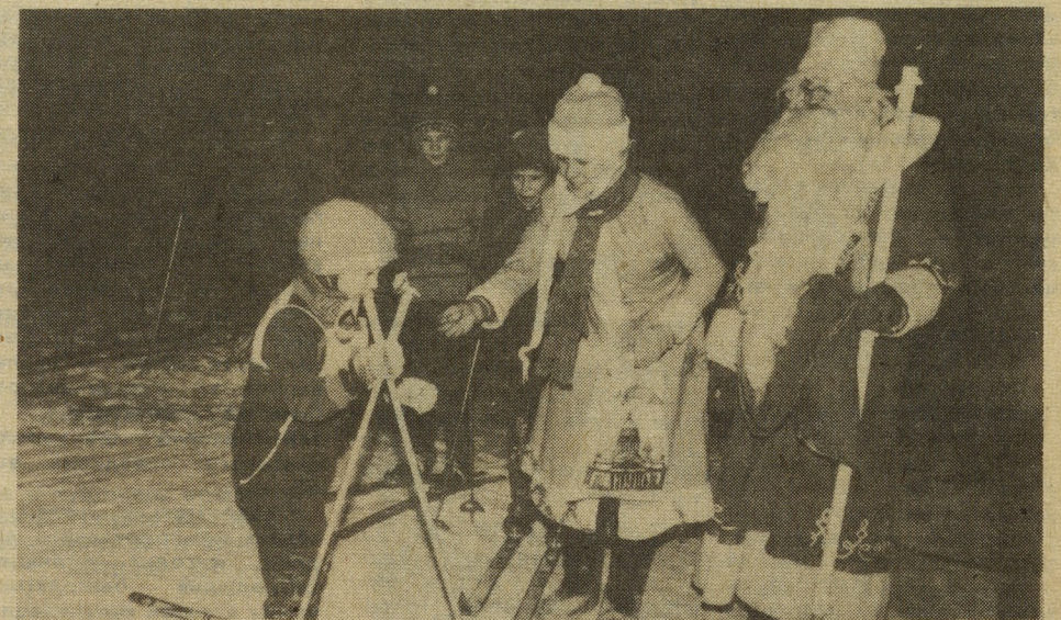
Новогодняя лыжня — лыжня необыкновенная. Дед Мороз и Снегурочка приветствуют юных участников гонки.