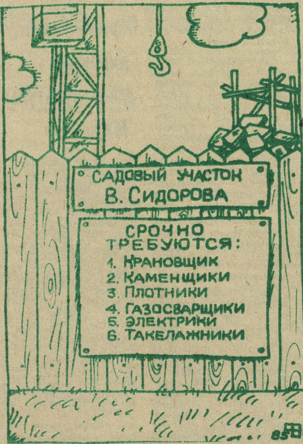
Рисунок А. Браза (вверху). Без слов... (слева).