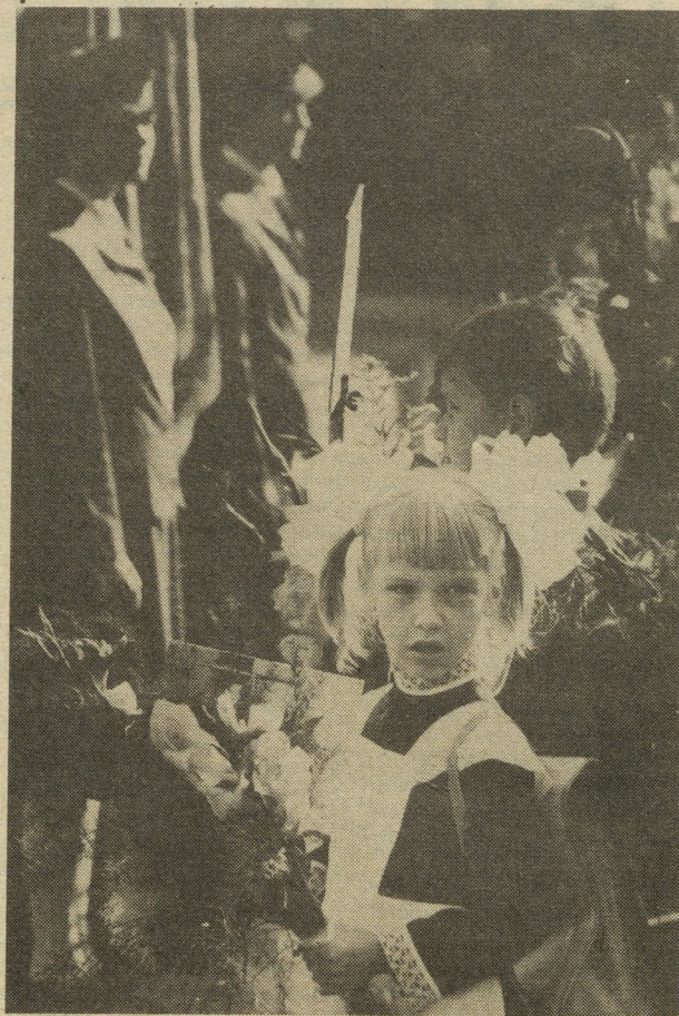
Первый раз в первый класс...

Всех, кто не сумел в свое время получить обязательное среднее образование,