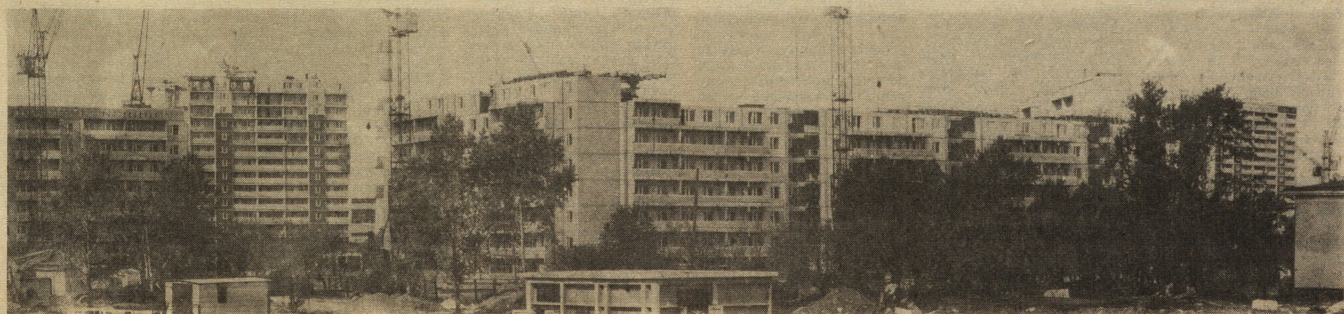
Панорама застройки нового микрорайона «Заречный».

В. АНОШКИН, начальник штаба «Комсомольского прожектора» СУ-27.