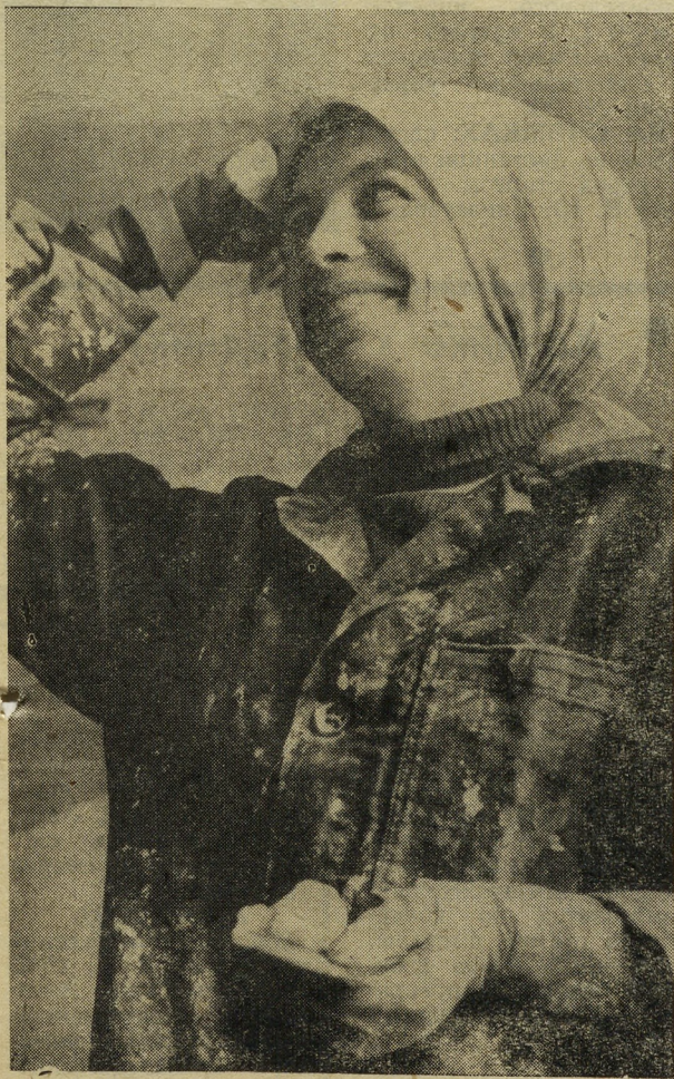
Хорошее настроение

Сейчас коллектив управления готовит достойные трудовые подарки к 50-летию присвоения городу имени Я. М. Свердловца.