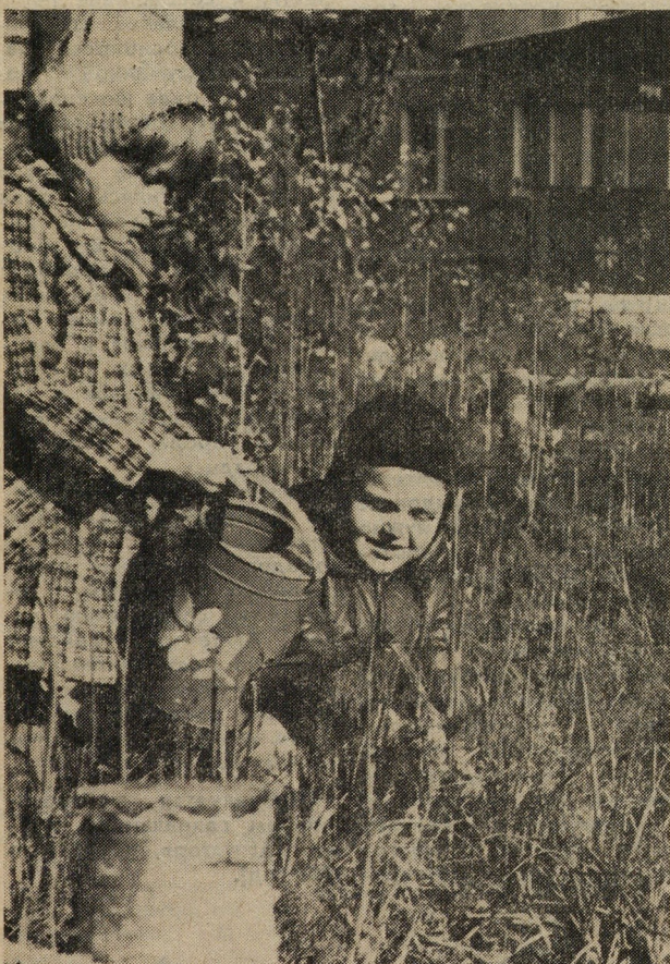
Сами вырастили! Снимок сделан в детском комбинате № 195.

В. МЫЛЬНИКОВ, инструктор по физкультуре.