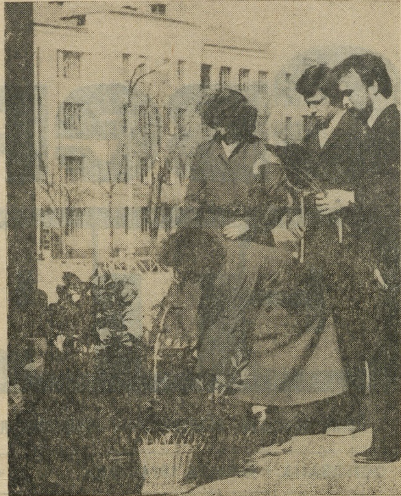
На снимках: молодые коммунисты; возложение цветов на площади 1905 года.