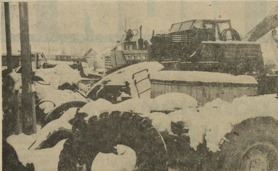
* «Комсомольский прожектор» — в действии!