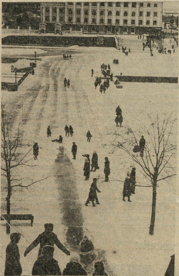
Февраль. В центре города.